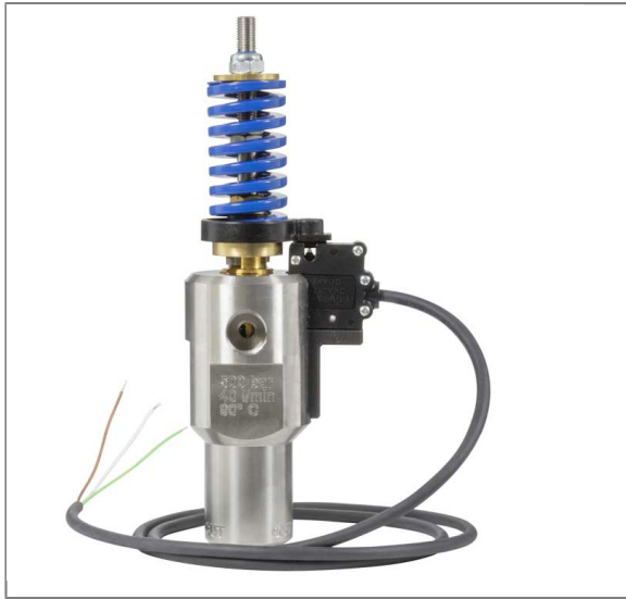
Suttner Unloadventil ST-275 mit Schalter

Eingang 3/8"IG Ausgang 1/2"IG Bypass 3/8"IG