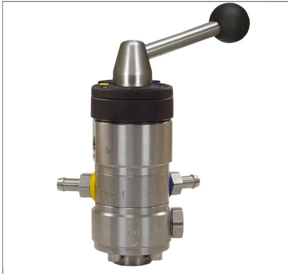
Injektor ST-164 ohne Druckluftanschluß

Eingang: 3/8" IG Ausgang: 1/2" IG Düsengröße 1,3 mm Ansaugung: 2 x Tülle 9 mm Regulierung der Chemiedosierung erfolgt durch 2 x 10 auswechselbare Dosiereinsätze (0,5 - 2,0 mm) Max. 350 bar / 100°C