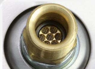
Integrierter Siebfilter: zur Vermeidung von Düsenverschmutzung