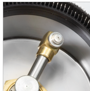
Robust: Drehgelenk für den professionellen Einsatz.