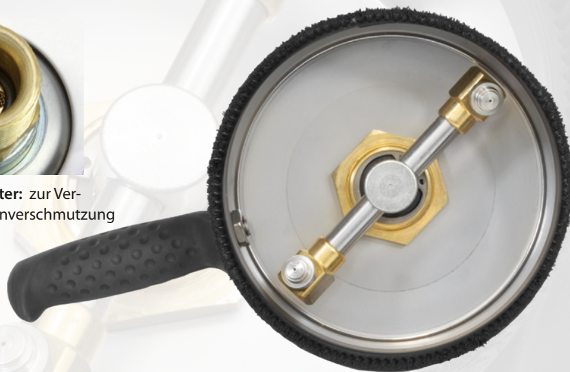
Vibrationsarm: Ausbalancierter Rotorarm in robuster Qualität